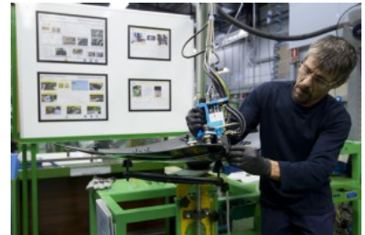
Proceso de premontaje de cristalería