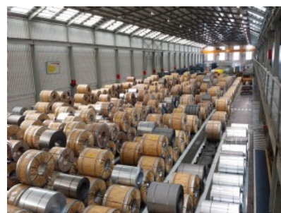
Almacén de materia prima