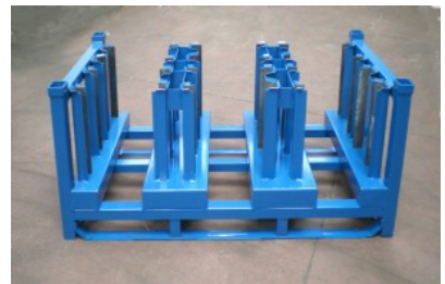
Contenedor de piezas