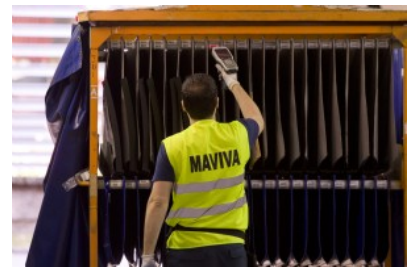
Carro de secuenciado para la entrega en la planta de montaje